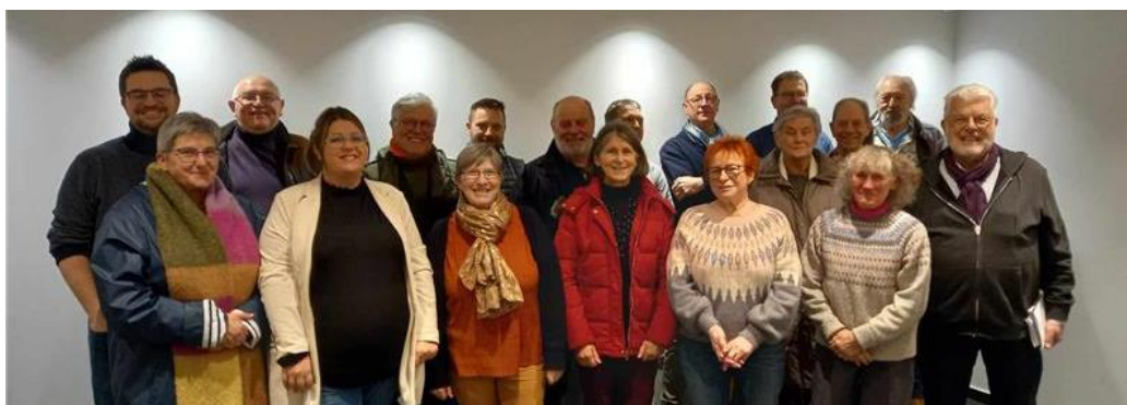
Photo de la nouvelle composition de la CLDR.