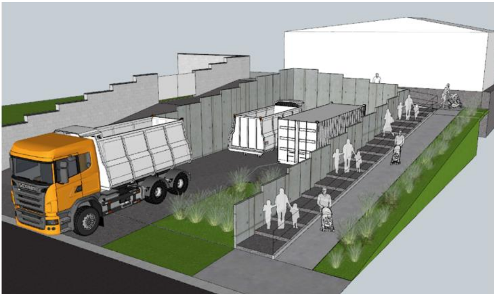
Illustration des futures installations : la chaudière est installée dans un conteneur et située à l'arrière de la salle de gym de l'école communale.

Les travaux ont débuté le 24 juin 2024 et devraient être terminés pour la fin septembre 2024.